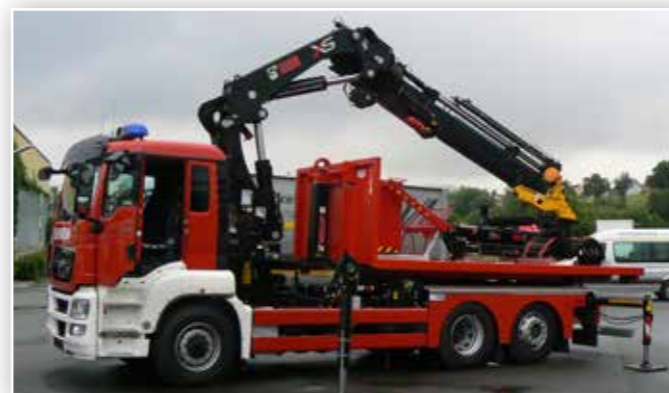
Wechselladerfahrzeug (WLF) mit Kran und Hubarbeitskorb