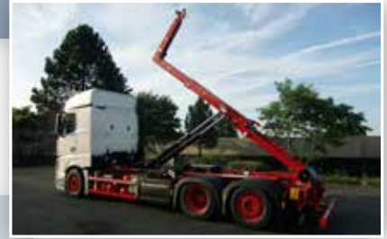
Abrollkipper mit Schubarmausführung