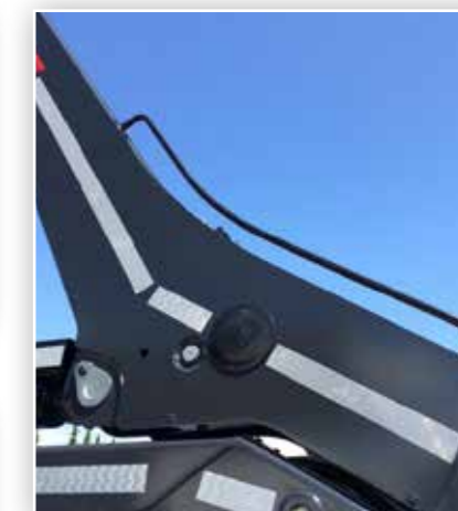
Sinnvoll geschwungenes Hubarmsystem beim Absetzkipper