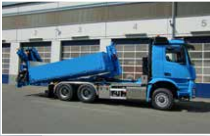
Abrollkipper mit Kran