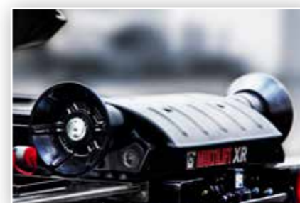
Stabile Rollenführung beim Abrollkipper