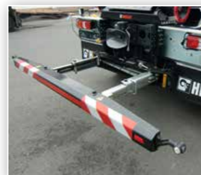
Verschiedene Unterfahrschutz-Ausführungen, starr, mechanisch oder hydraulisch verschiebbar, klappbar, etc.