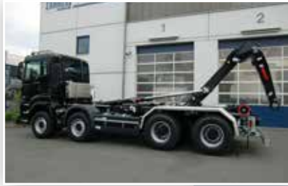
4-Achser Abrollkipper mit Schub-Knickarmausführung