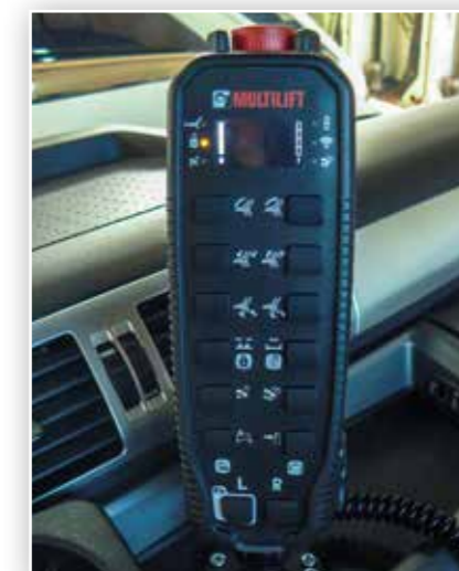
Funksteuerung optional mit Wiegesystem