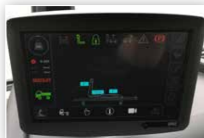
Übersichtliches Display für alle Funktionen des Abrollkippers