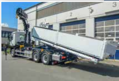
Abrollkipper mit Kran hinter dem Führerhaus