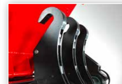
3-fach Kipphaken beim Absetzkipper