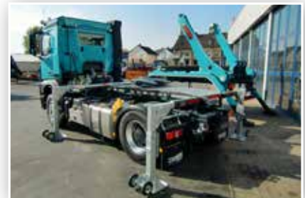
Absetzkipper mit Schnell-Wechselsystem, hier Absetzkipper wechselbar mit Sattelkuppung