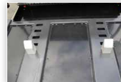
Container-Stopps beim Absetzkipper