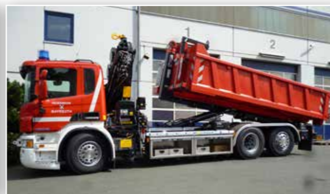
Wechselladerfahrzeug (WLF) mit Kran und Abrollpritsche